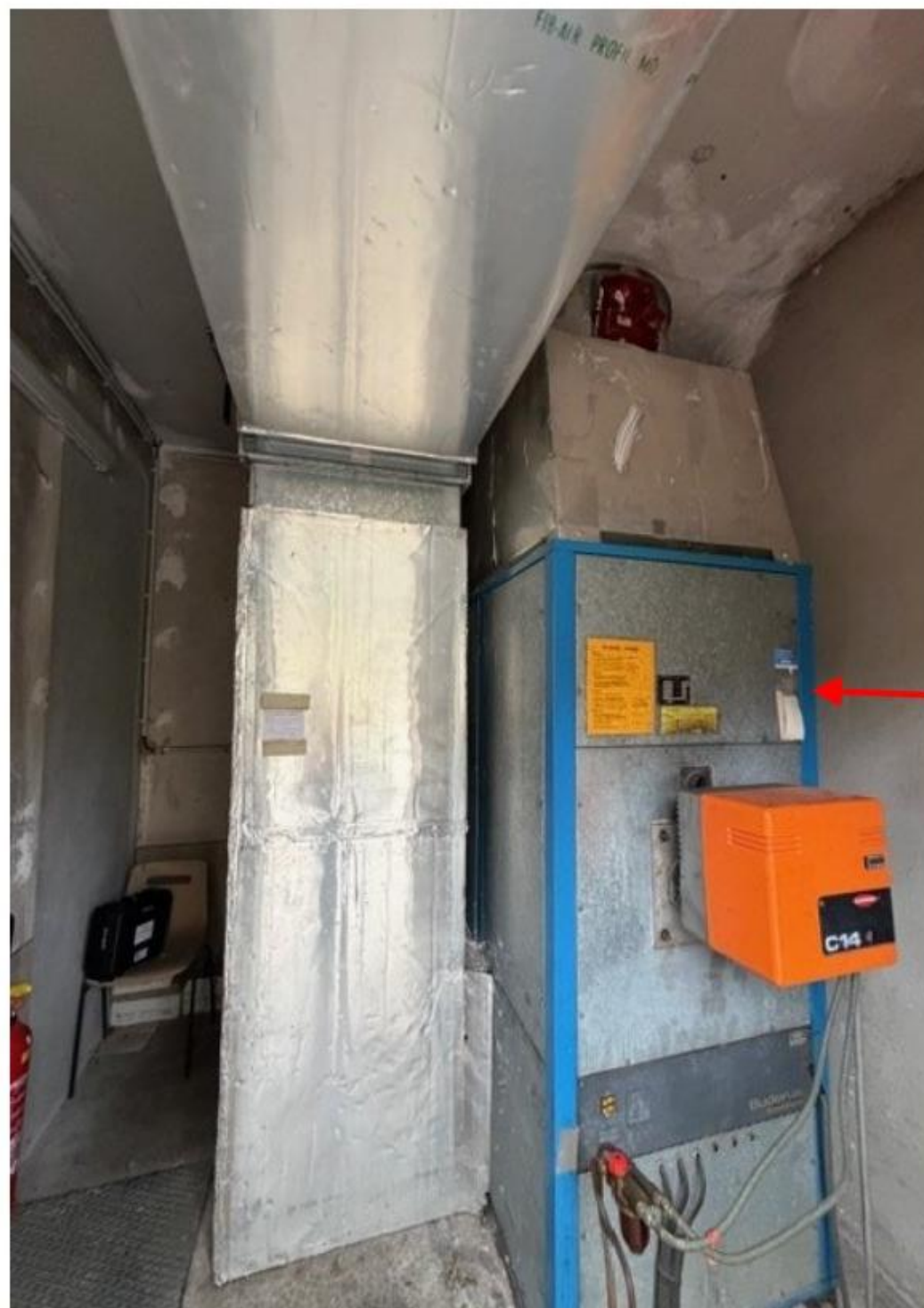
Planche de repérage technique